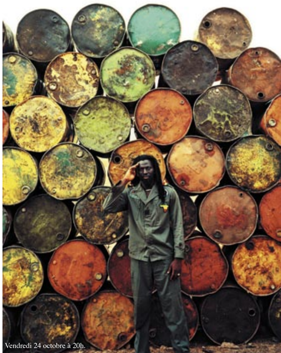
Vendredi 24 octobre à 20h.

LE REGGAE A SON NOUVEAU PRINCE, VENU D'AFRIQUE, AUSSI IMPRESSIONNANT EN VERSION LIVE QUE SUR DISQUE ! RENCONTRE D'UN PERSONNAGE.